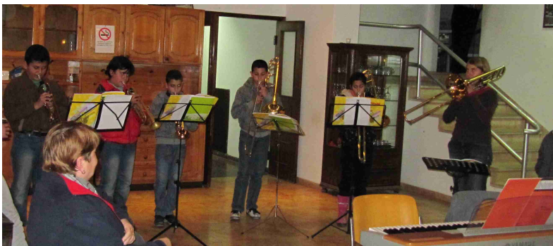
Auftritt beim Adventskaffee in Talitha Kumi

Vor mir tut sich die sandfarbene Stadtmauer der Jerusalemer Altstadt auf. Von der Bushaltestelle am Jaffa-Tor laufe ich zur Haltestelle, der gerade mal vier Monate alten Straßenbahn. Im Vergleich zum Bethlehemer Straßengeschehen herrscht hier ein fast europäisches Flair. Von sanfter Jazzmusik aus der Einkaufsmeile berieselt, beobachte ich das Zusammentreffen so vieler unterschiedlicher Lebensstile, von denen ich durch das Betrachten auf der Straße ja nur eine Ahnung bekomme. Modisch gekleidete Jugendliche mit Kippah und Zizit spielen sich die neusten Songs auf dem Handy vor. Ein äthiopischer Jude schreitet durch einen Metalldetektor, bevor er die Shopping-Mall betritt. Neben mir steht eine junge jüdisch-orthodoxe Mutter mit Kinderwagen und wartet, umringt von sechs Kindern, auf die Straßenbahn, die schon bald hupend einfährt. Anscheinend sind die Jerusalemer den Umgang mit Straßenbahnen nicht gewohnt und müssen noch lernen, wie man mit ihr fährt. Denn als sich die Türen öffnen entsteht ein großer Stau. Noch niemand scheint die Prozedur „ Erst raus, dann rein! “ zu kennen, geschweige denn anzuwenden. Und so dauert es einige Zeit, bis sich jeder durch die Tür geschoben hat. Langsam fährt die Bahn wieder an. Eng umgeben von arabischen, hebräischen, englischen und manchmal auch russischen Dialogen nähere ich mich meinem Ziel, der Musikakademie, um dort eigene Trompetenstunden zu nehmen.