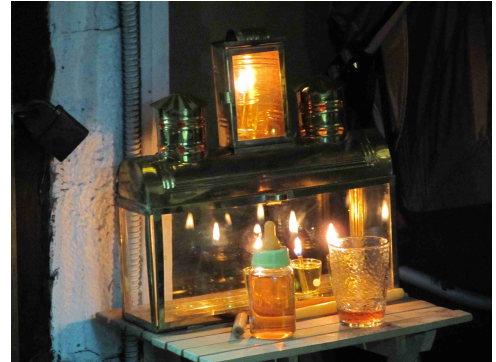
Am dritten Chanukka-Abend

Bis zur Abfahrt des Busses nach Beit Jala bleibt mir noch ein wenig Zeit und so schlendere ich durch den jüdischen Teil der Altstadt. Auf einem kleinen Platz wird ein Chanukkah-Lied auf die Melodie von „Tochter Zion“ angestimmt. Und so gerate auch ich ein wenig in Vorfreude auf das Weihnachtsfest, welches ich in diesem Jahr mal ganz anders erleben darf.