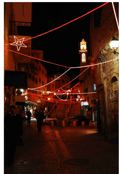
Eine weihnachtlich beleuchtete Straße in Bethlehem

Und schon jetzt freue ich mich wieder auf die darauf folgende Arbeit mit den Kindern. Wir werden uns insbesondere wieder um musikalisches Vorankommen bemühen und ich bin sehr gespannt, was wir alles schaffen können.