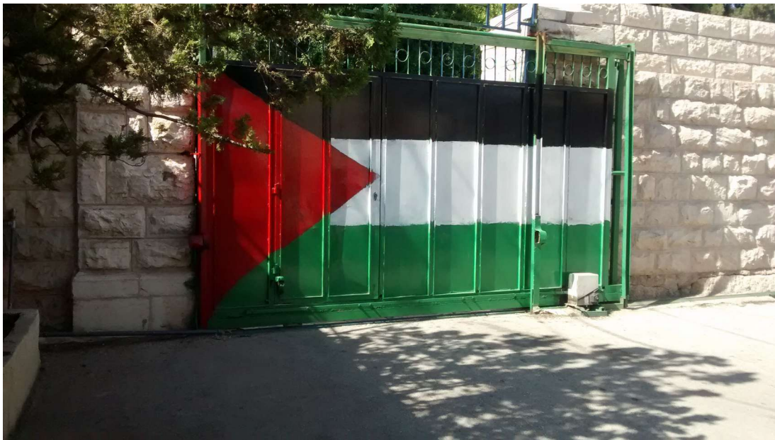
(Das Hoftor in der lutherischen Schule Beit Sahour wurde neu gestrichen)

Bis zu meiner Ausreise verbleiben noch zwei Monate, dann heißt es Abschied nehmen. Der Abschied wird sehr schwer, doch weiß ich schon jetzt, dass ich definitiv zurück kommen werde, nicht nur zum Marathon im April 2017, sondern sicherlich auch viele weitere Male.